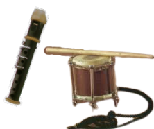
FLABIOL I TAMBORÍ