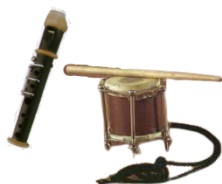
FLABIOL I TAMBORÍ